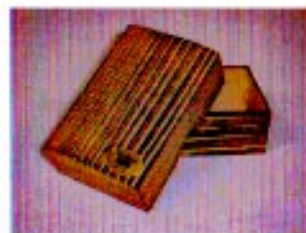
名刺入 ¥2,000 (7.0 × 10.5 × 4.0)