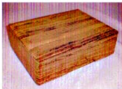
文庫 ¥10,000 (23.2 × 31.7 × 8.5)