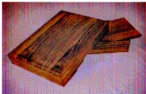
硯箱 ¥5,400 (21.5 × 31.0 × 5.8)