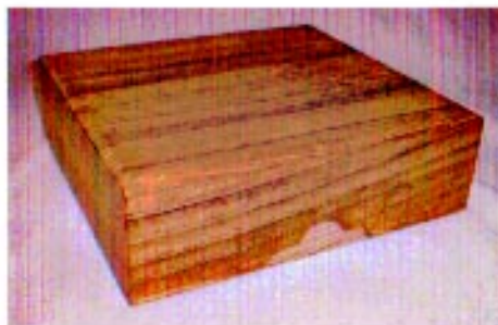
色紙入 ¥12,000 (32.0 × 35.3 × 11.3)